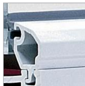
Listwa przyszybowa FORIS